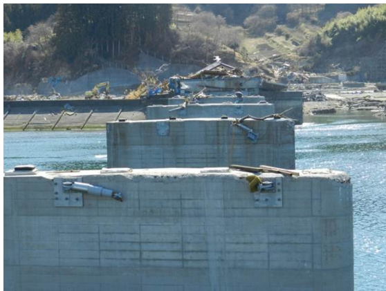
写真1 陸前高田市気仙大橋の落橋の概要