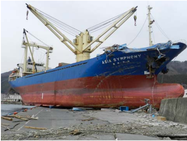
写真3 釜石港における船舶の座礁