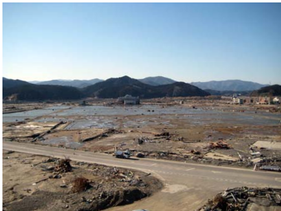
写真2 陸前高田市における津波による浸水被害