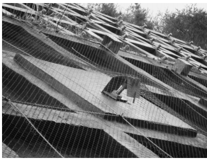
写真一12 磐越自動車道の切土斜面のアンカー工の変状