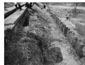
b)法面小段下の亀裂