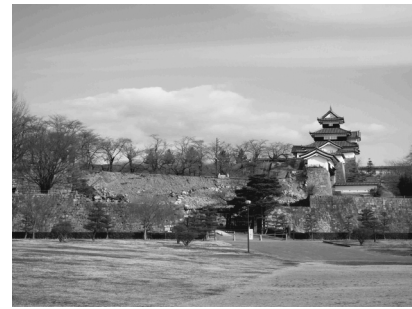
写真一16 白河市小峰城の石垣崩壊

常磐自動車道の山田町周辺の切土斜面では、4月11日の余震により流れ盤を呈する泥岩斜面が鉄塔基礎位置より崩壊し、下り線の閉塞が生じている。写真一13に崩壊面を整形した法面保護工による復旧状況を示す。