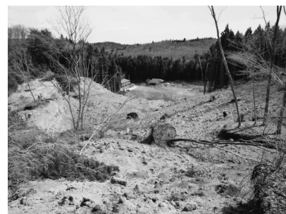
写真-4 滑落崖より崩落方向(②)