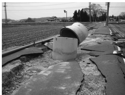
写真一14 須賀川市長沼におけるマンホールの浮き上がり