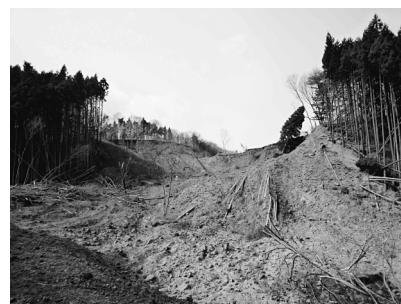
写真-3 崩落土塊の下方から滑落崖(①)