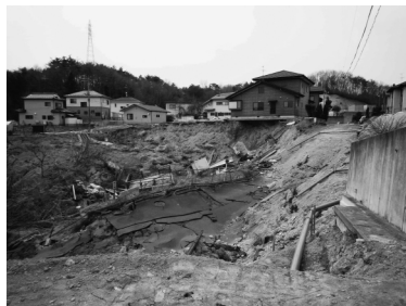
写真一八 須賀川市木之崎の造成盛土の崩壊