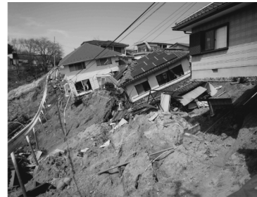
c)滑落崖周辺の住宅