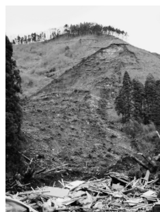
写真-5 いわき市田人町石住地区の斜面崩壊

本震による斜面崩壊は比較的規模の大きな崩壊が白河市の葉ノ木平地区や大信地区に生じ、余震ではいわき市南部の震源近傍に生じている。ここで、白河市の葉ノ木平地区で生じた斜面崩壊により10戸の家屋が全壊し、13名が亡くなっている。崩壊の位置図を図-4、図に示す方向より見た崩壊状況を写真-3, 4に示す。図-4に示す様に斜面崩壊の形態は「く」の字型で、上下二つの崩壊から構成される。上部の一部はゴルフ練習場方