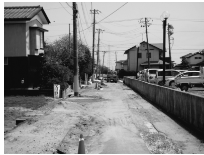
写真一15 いわき市 k-net 勿来周辺の噴砂