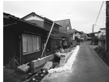
b)滑落崖周辺の住宅