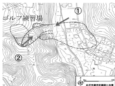
図-4 葉ノ木平地区の地形図と斜面崩壊位置図(白河市都市計画図を使用し作成)