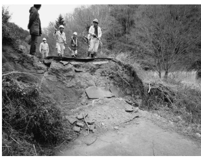
写真-1 塩の平断層(仮称)の最大断層変位位置(a)