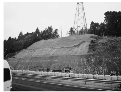
写真一13 常磐自動車道の切土斜面の復旧状況