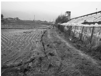
写真一11 東北自動車道の軟弱地盤上の盛土部の変状