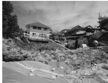
b)すべり土塊より滑落崖方向