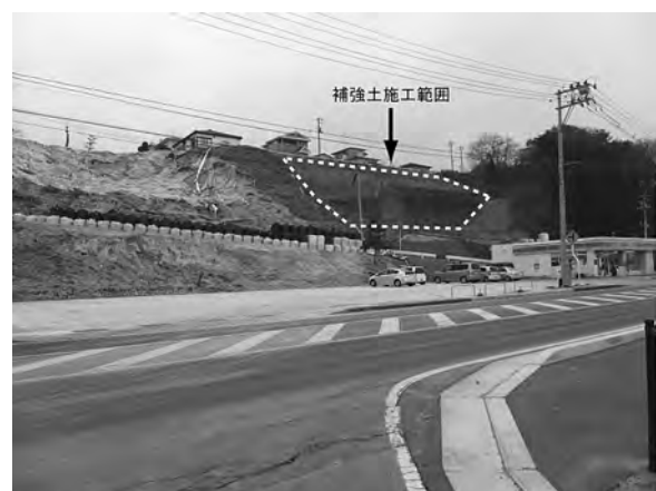
写真一 山元町造成宅地 (位置①) 被害状況 (図一 崩壊 A)

m 以上流され、陸側の家屋前面の防風林に衝突して止まっていた。レールや枕木は流亡している。