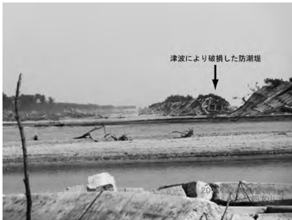
写真一五 山元町笠浜地区 (位置⑦) 防潮堤被害状況