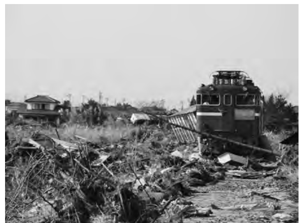
写真一八 山元町北泥沼地区 (位置⑤) 鉄道被害状況

阿武隈川左岸の河川堤防に, 写真一七に示すように, 円弧すべりが生じている。堤防天端に約40 cmの段差が生じているが, 堤防中腹における円弧すべり破壊の末端