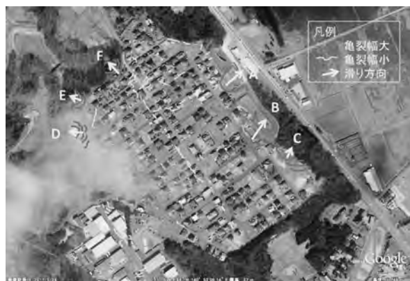
図一 山元町内の造成宅地における斜面崩壊位置 (Google Map に加筆)