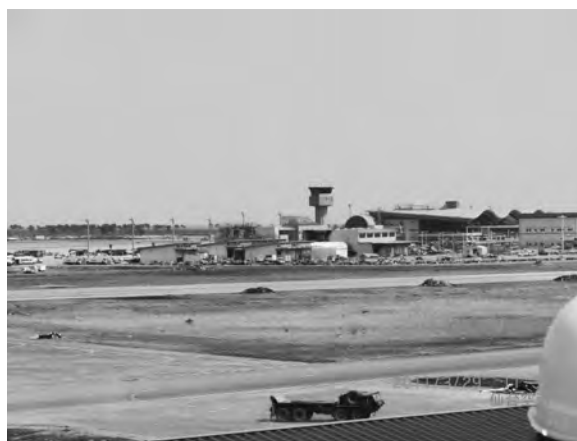
写真一1 仙台空港（位置②）被害状況

写真一3に示すように、津波により岸壁のコンクリートブロック（2 m×2 m×6 m）が内陸部に乗り上げ、さらに10～30 m流されている。岸壁背面の地盤は洗い流されている。また、国土院測地観測センターによると地震によるプレート移動により沿岸部の標高が約40 cm低くなっている。海面と岸壁上面が近づいていることから、今後の漁業再開において、水揚げ作業等に支