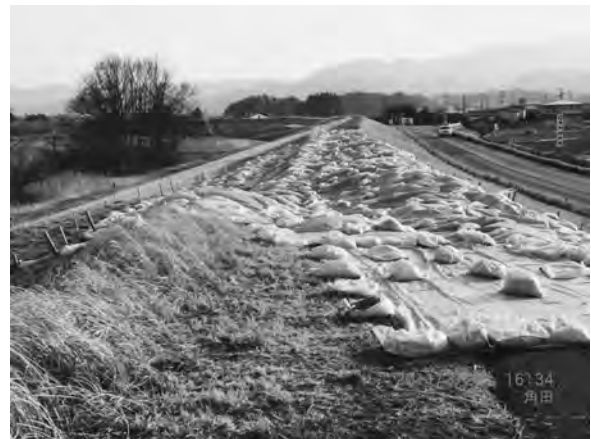
写真一七 角田市野田地区河川堤防 (位置⑥) 被害状況

断続的に破壊されている。防潮堤の高さは約6.5 m, 亶理町鳥の海地区の被害形態と同様に, 写真一五に示すように防潮堤の背面(陸側)が大きく浸食され, 約50 mの浸水帯が生じている。