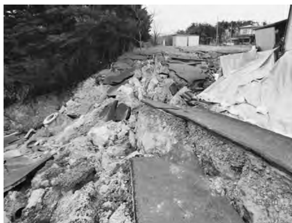
写真一 山元町造成宅地 (位置①) 被害状況 (図一 崩壊 D)