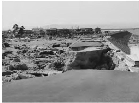
写真一六 亶理町荒浜地区河川堤防 (位置③) 被害状況