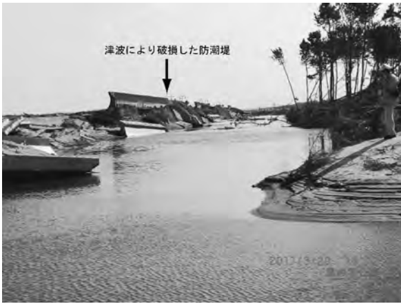
写真一四 亶理町鳥の海地区 (位置④) 防潮堤被害状況