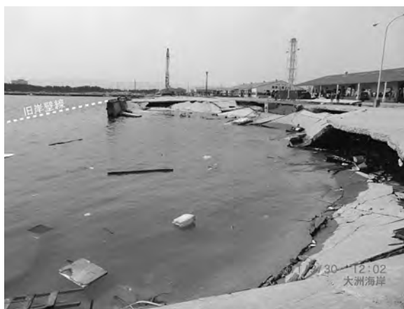
写真一2 相馬港岸壁（位置⑨）被害状況