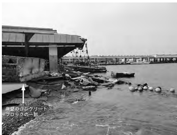
写真一3 松川浦漁港（位置⑩）被害状況