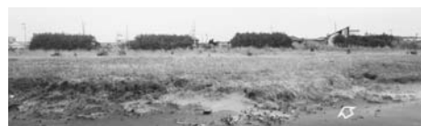
写真—37(a) なぎさりフレッシュ事業による保安林：横根 F