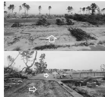
写真一49 津波の通りやすさと被害の差異：写真上は防潮堤から遠望・写真下は背後の住宅地：荒浜①

点5の水域相当と考えられ、減勢効果も考えられる。 【知見16】 保安林の樹木は、密生していると減勢効果は高いが、樹高、浸水深に依存する