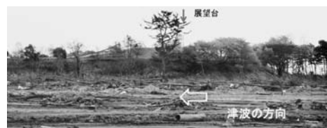
写真—54(a) 津波を避けた高盛土：海浜公園冒険広場②