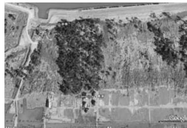
写真—36 津波後の保安林と写真—35の住宅：東浦④