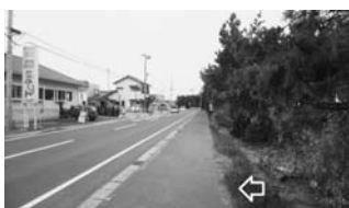
写真一38 写真一37の保安林の山側の状況：横根 F