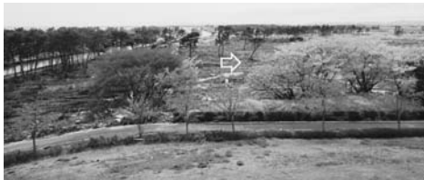
写真—56 高盛土からの俯瞰（南側）：海浜公園冒険広場②