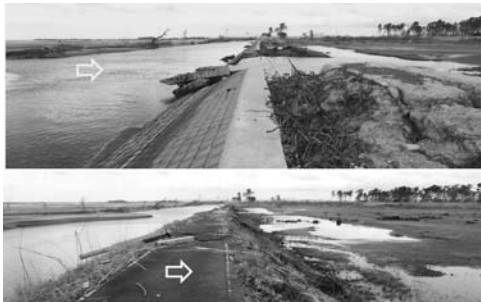
写真-67 貞山堀の山側の堤防：写真上は破堤，写真下は侵食止まり：井土浦⑤