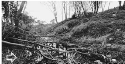
写真—57 津波を受けた高盛土の前面：海浜公園冒険広場②

なお、写真—56は展望台から見た高盛土の南側の様子であるが、写真—54(b)の倒木から分かるように、隣接してあった保安林の立木は見当たらない。