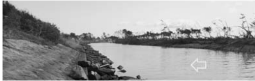
写真-66 貞山堀の海側の表法：東浦④