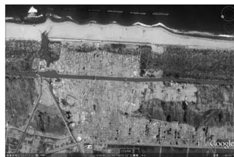
写真一42 保安林を開拓した住宅地〔地震後〕荒浜①

写真一42は、保安林の幅が異なる住宅地における津波後の衛星写真である。ここでは、600 mほどの幅がある保安林を切り開いて造成されており、保安林の狭小部は50 m程度であり、広い箇所は、元来、写真のように二