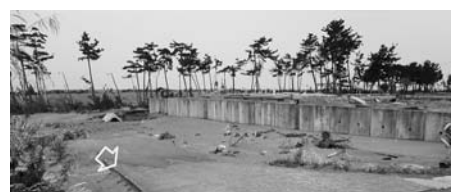
写真一45 保安林幅が狭い防潮堤背後の住宅被害：二の倉⑦

重になっていたかは不明であるが、300~450 mの幅である。防潮堤から250 mほどに貞山堀があるが、写真一43は貞山堀から山側を遠望した状況であり、写真一43(a)は幅が広い保安林の背後地であり、写真一43(b)は幅が狭い保安林の背後地である。衛星写真および現地状況から、幅が広い保安林の背後地では残存している住宅も見られるが、幅が狭い保安林の背後地では住宅はほとんど流出していることが分かる。このように、保安林の幅が住宅の被害の程度に関係があることが示唆される。