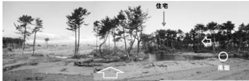
写真一46(b) 写真一46(a)に隣接した保安林の流出箇所：東浦④

真であるが、海岸線から900 m 辺りに貞山堀(写真の下)があり、写真一42と同様に、幅600 m 程度の保安林を切り開いて、貞山堀と海岸の間に住宅や工場が建てられている。そのため、海側に残された保安林の幅は50 m 程度であるが、道路が通っていたり、松の木の生え方がまばらである印象が強く、防潮機能は小さいと思われる。そのため、写真一45のように、海に近い住宅は流出し、住宅地内のアスファルト舗装の道路の山側が洗掘されたりしている。なお、写真一44を詳細にみると、工場の建物が残留しており、一般住宅との構造の違いはあるものの、工場位置での保安林の幅が住宅地の3倍程度あることから、保安林の幅の効果も示唆していると思われる。 【知見15】 落堀が保安林に対する減勢に効く