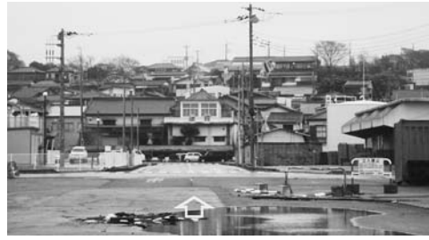
写真—58 港側からの砂丘上の住宅地の遠望：大洗港

写真—58は茨城県大洗町の大洗港であり、海側からの北側の住宅地の遠望である。岸壁から約200 m からは高さ20~30 m 程度の砂丘地形の高台であり、斜面南向きに住宅地が形成されている。岸壁から100 m 程度離れ