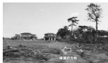
写真—35 保安林により流出を免れている住宅：東浦④

また、写真—39は、保安林の中を海岸線に向かって作られた道路盛土である。貞山堀の水門から防潮堤まで280 m程度であり、天端幅6 mの両法肩は地震前から鉄板が幅1 mで全長に置かれていた。盛土は高さ3 m程度であり、法面は芝である。道路盛土の中間部分