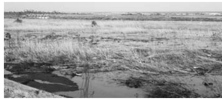
写真-68 広大な湿地，浦などの存在：井土浦⑤