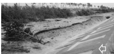
写真—52 裏法尻で樹木の侵食：荒浜①