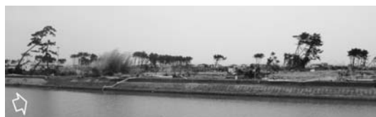
写真一43(a) 幅が広い保安林の背後地：荒浜①