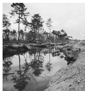
写真—64 堤防の裏法尻に形成された落堀：井土浦⑤

を考察したが、ここでは落堀を水域として捉える。現地調査では、洪水時と同様に、防潮堤、堤防などの裏法先で形成される落堀が随所で見られているが、津波の浸水中に新たに形成される水域として見ると、対策に関係すると思われる新たな知見が見えてくる。