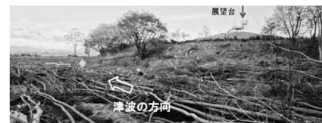
写真—54(b) 写真—54(a)の海側からの状況：冒険広場②