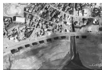
写真—37(b) 写真—37(a)の上空からの状況：横根 F