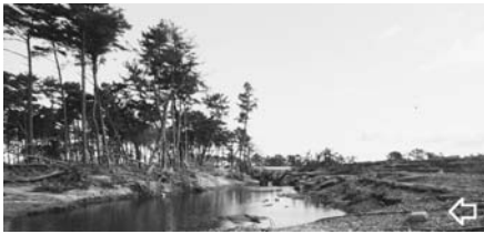
写真一46(a) 盛土の裏法尻に形成の落堀と保安林：東浦④