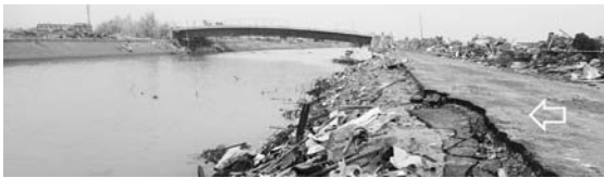
写真-65 貞山堀の津波が下る側の法面：荒浜①