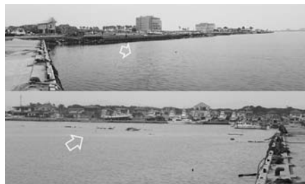
写真—63(a) 荒浜港の沿岸：写真上は背後の海側から流入、写真下は港の北側の様子：荒浜港⑥