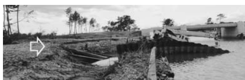
写真一40 写真一39の突き当たりの水門付近の被害：井土浜③