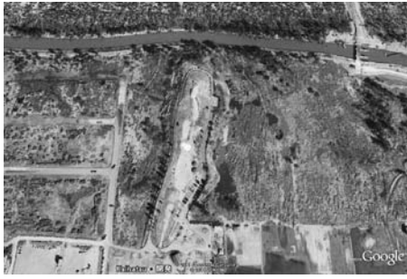
写真—55 上空からの高盛土：冒険広場②：上が海側