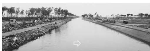
写真—62 津波が通過した貞山堀：荒浜①

裏法侵食について、知見7 1) では越流による裏法先の侵食、知見17では裏法先付近の樹木に対する裏法の侵食の影響、知見15では落堀の保安林に対する減勢効果