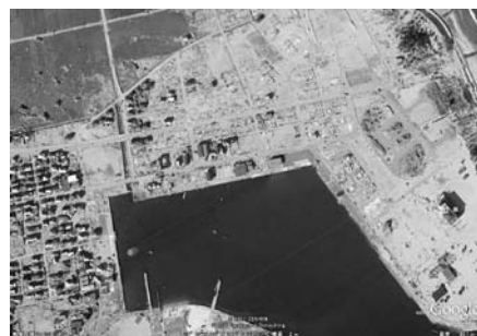
写真—63(b) 津波後の荒浜港周辺：右が海側