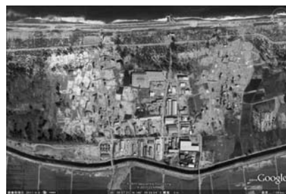
写真一44 保安林の開発による住宅、工場：二の倉⑦