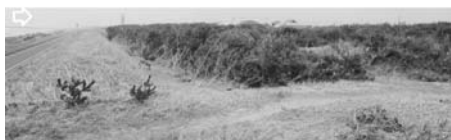
写真—50 津波（小規模）後の保安林：足川浜 B