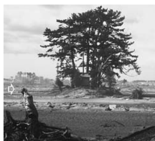
写真一41 松に守られた祠：荒浜①

の被害は無いが、水門側は全体的に侵食を受け、アスファルト舗装が剥離し、鉄板が飛ばされている。他方、防潮堤側は両法面、法尻が侵食し、防潮堤の裏法の侵食部分につながっている。水門周辺の貞山堀では、写真一40のように、堤防の侵食、重機の転落が見られる。このように、保安林を取り除いたオープンな空間である道路は、津波の通路になり、被害を大きくしたと思われ、言い換えれば、保安林の減勢効果を減じたということになる。