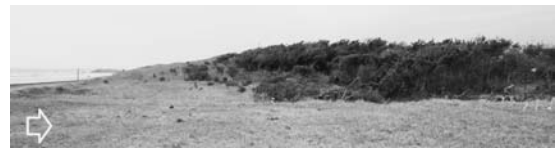
写真—61 勾配の緩い自然砂丘：足川浜 A

たコンビニエンスストアでの浸水深は約1.5 m であり、海面からの岸壁高を2 m とすると、浸水高は3.5 m 程度と想定される。したがって、津波は砂丘斜面下端部に達した程度であるが、さらに高い津波では遡上が発生すると思われる。