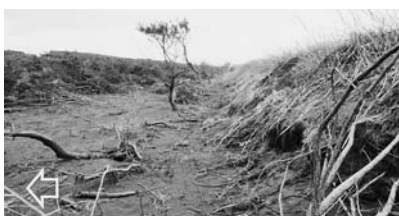
写真—53 裏法尻での樹木の侵食：西足洗 D

け、その程度により根洗い、倒木、流出がある 防潮堤の裏法先は、樹木が植生されていることが多いが、越流により法先が洗掘される。写真—52は侵食により、倒木あるいは流出した状況であるが、写真—53は侵食が写真—52より軽微であり、樹木も残存している。さらに、侵食が小規模な場合は発生しないこともある。