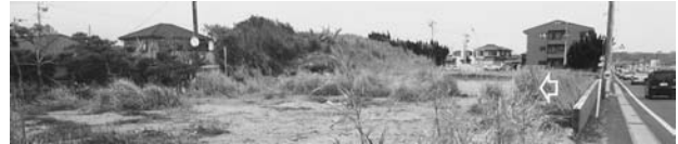
写真—59 津波を避けた自然砂丘地形：横根 F