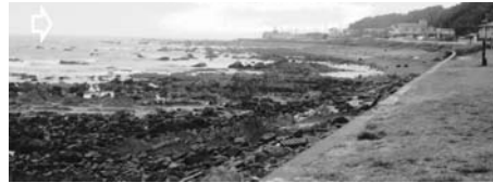
写真-69 防潮堤の前の白亜紀層海岸：茨城県ひたちなか市