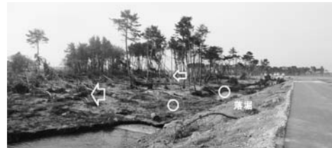
写真一47 盛土の裏法尻の侵食と保安林：井土浦⑤

なお、既出の写真一10(b) 1) では防潮堤が全体的な破壊をすると、落堀が形成されないことに言及した。さらに、同写真の上方あるいは下方の落堀の背後を見ると、保安林はある程度が残留し、その前面の防潮堤では落堀が形成され、かつ裏法は表層侵食に留まっている。ここで、防潮堤が全体的な破壊をすると、落堀が形成されないため、落堀の形成による減勢効果を期待する場合は、防潮堤が破壊しないこと、させないことが前提条件になると思われる。なお、ある程度の規模がある落堀は、視