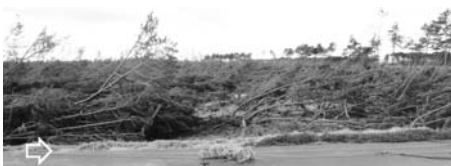
写真—51 津波（大規模）後の保安林：井土浜③