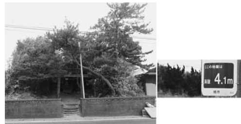
写真—60 写真—59の砂丘背後の三峰神社と道路沿いの海拔表示：横根 F