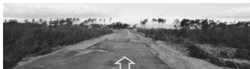
写真一39 海側から見た海岸への進入路：井土浜③