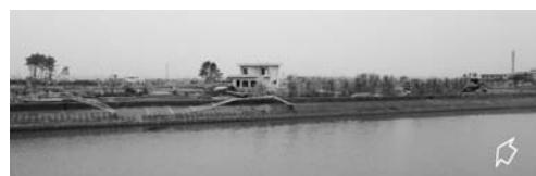
写真一43(b) 幅が狭い保安林の背後地：荒浜①