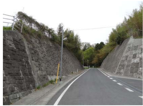
写真 18 女川町宮ケ崎の地山補強土工（下側から）

以上のように、当該地山補強土工の周辺では、今回の地震による被災や変状が至るところで確認でき、本震と余震による強い揺れがあったことが推察できる。