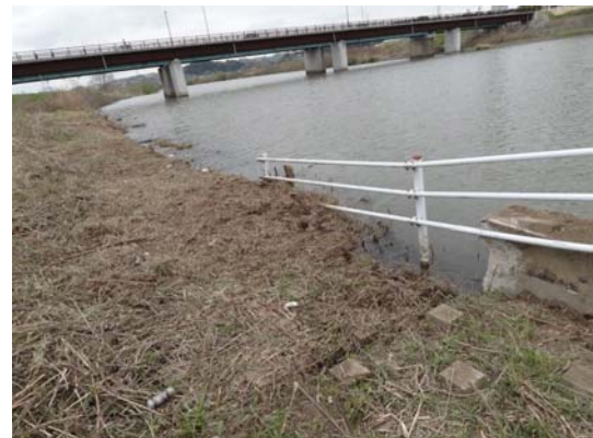
写真 14 液状化による護岸の沈下