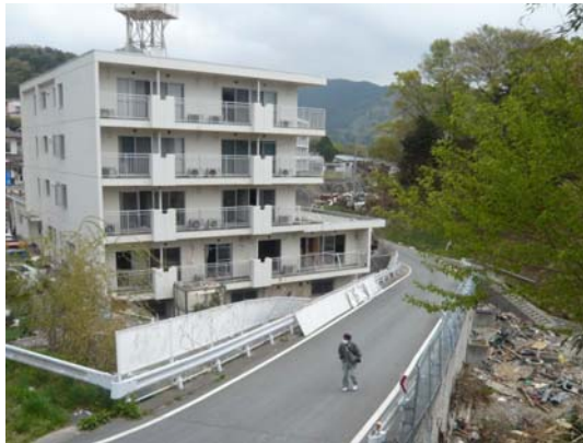
写真 21 下側に近接したマンションの被災状況