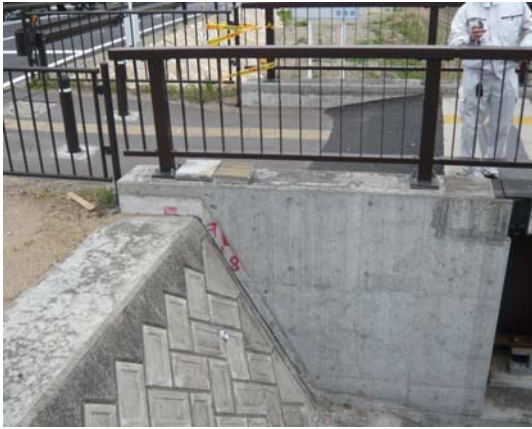
写真 15 宝堰橋歩道橋の左岸橋台部の沈下