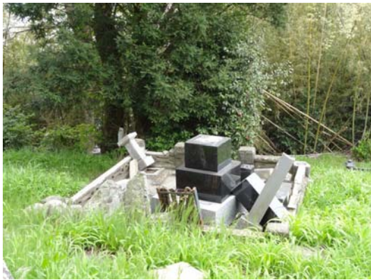
写真 22 地山補強土工後背地の墓地での墓石の倒壊