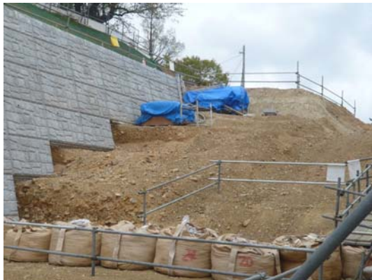
写真4 切土中の地山の土層