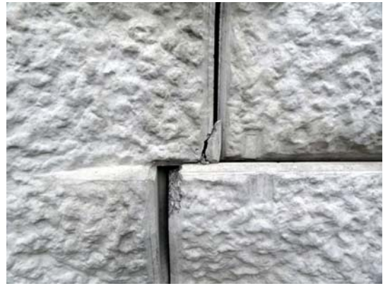
写真6 盛土補強土壁のパネル端部の若干の損壊