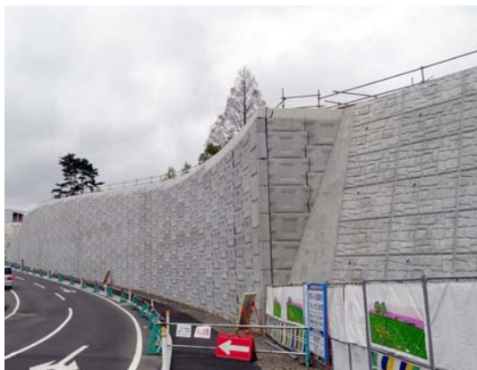
写真5 隣接する盛土補強土壁構造物

先述のように当該地山補強土工には、写真5に示すように盛土補強土壁構造物が左側に隣接している。調査時点においては、盛土補強土壁前面の歩道が簡易防護柵によって立入禁止処置がなされていた。写真5からわかるように、盛土と切土の境界部の盛土側の出隅部にあたる箇所において、パネル間の目地に若干の開きが発生していた。また、地震時にパネル同士が激しく接触したことにより、端部に若干の損壊が見られるパネル（写真6）や、おそらく位置決めのために上下のパネルを貫通して挿入されている直径1cm強の樹脂製の棒状部材が、上下パネル間のずれに伴い破断している箇所がいくつか見られた（写真7）。ただし、変状はわずかに留まり、構造物全体としての安定性は十分に確保されていた。