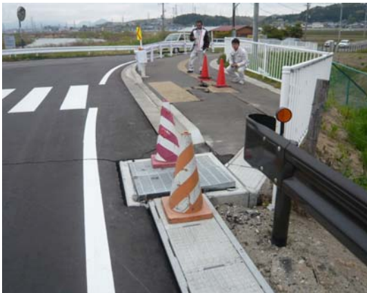
写真 16 宝堰橋の右岸側の変状