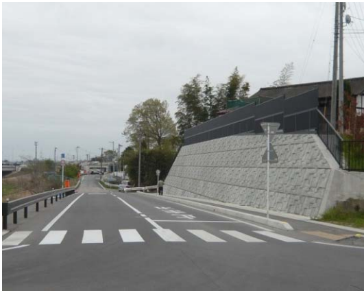
写真 8 仙台市泉区松森の地山補強土工（上流から）