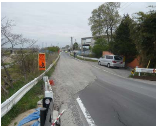
写真 11 下流側堤防道路のすべり破壊

りから上流側にかけての 20m あまりの区間においては、護岸が沈下して完全に水没している部分があり（写真 14）、河床が液状化したと考えられる。前述の河川敷の側方流動も液状化に起因すると思われる。