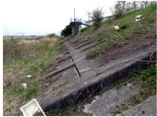
写真 12 堤防のコンクリート護岸の損壊状況