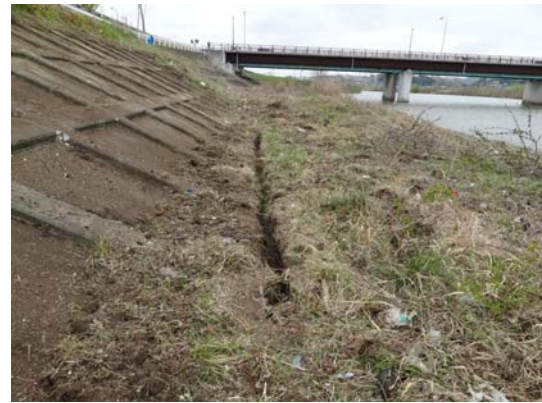
写真 13 堤防法尻に発生した亀裂