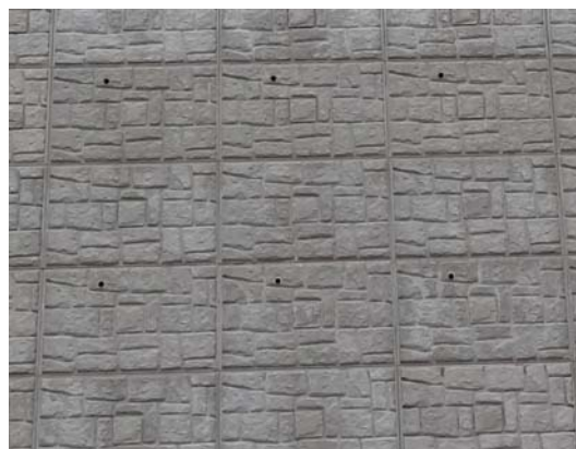
写真2 壁面パネルの状況

では、基本的にそれぞれのパネルの中心に、鉄筋補強材が1本ずつネイリングされている。本地点を含めて、以下に報告する地山補強土工はすべてこのタイプである。