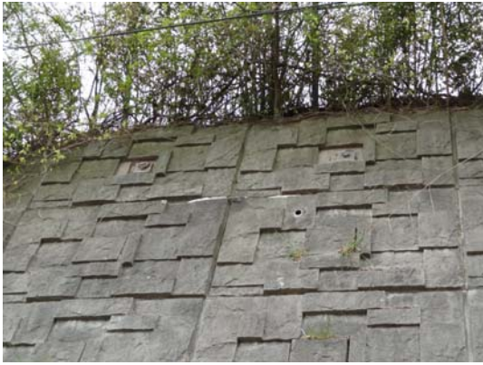
写真 20 最上段パネルでのキャップの離脱