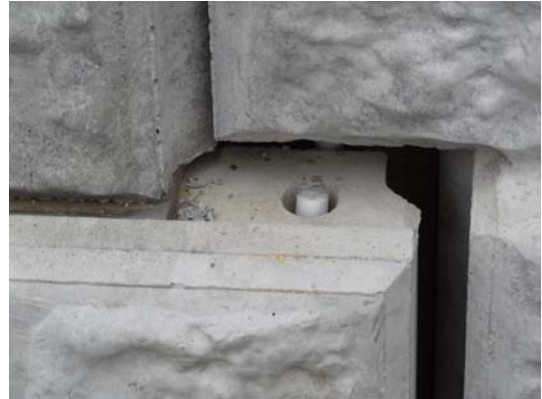
写真7 盛土補強土壁の樹脂製棒状部材の破断