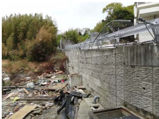
写真 23 津波によって水没した高機能盛土

ておらず、女川原発で震度 6 強を記録した 4 月 7 日の余震時に外れたものと考えられる。ただし、鉄筋補強材自体が抜け出すなどの変状は一切見られず、最も揺れが増幅された法面最上段において、接着力の経年低下も起因して、キャップ単体が外れたものと推察される。