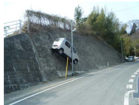
写真 19 津波遡上による水浸の痕跡（4月2日撮影）