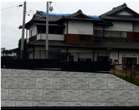
写真 17 地山補強土工の后背地に建つ民家

の開口や蓋の浮き上がりが見られた。これは、3月11日の本震で被災した道路面を応急復旧したものの、4月7日に発生した最大余震によって再度被災を受けた可能性が考えられる。また、当該地山補強土工の上部背後地にある民家の屋根がブルーシートで覆われており（写真17）、地震によって屋根瓦が被災したと思われる。