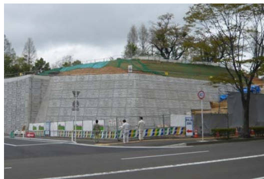
写真1 仙台市太白区八木山本町の地山補強土工

当該地山補強土工の壁面には、プレキャストコンクリートパネル(約2m 2 /枚)が用いられている。本工法で