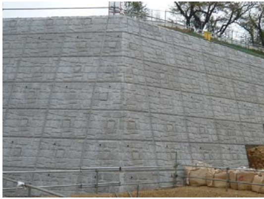
写真3 出隅部の状況