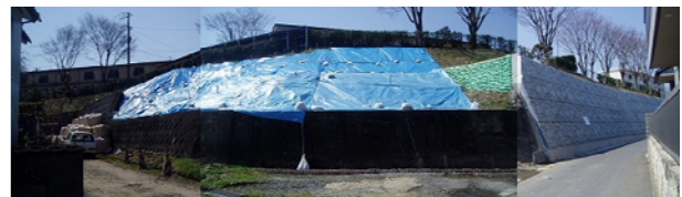
写真 24 地山補強土工法により耐震補強された既設盛土

本章では、本調査団の服部が 4 月 14 日に別途実施した福島県での調査事例を紹介する。写真 24 は全体が同一の既設盛土である。写真の右側は地山補強土工法によって耐震補強されていたが、中央部に見える出隅部は重力式擁壁であり、左手はブロック積み擁壁である。写真の左右にかけて盛土法面は直角よりやや緩やかにカーブしている。同じ盛土内でも、無対策の重力式擁壁とブロック積み擁壁の上部には円弧状のすべり崩壊が発生しており、全体にブルーシートがかけられていた。一方、耐震補強区間の法面には一切変状は見られず無被害であった。本事例は、地山補強土工が既設盛土の耐震化にも有効であることを端的に示している。