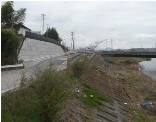
写真 9 仙台市泉区松森の地山補強土工（下流から）