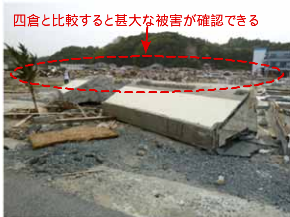
図—7 平薄磯における防波堤後背地の状況

ものと思われる。防波堤の後背地の被災状況を図—7 に示す。破壊された防波堤および後背地から、津波が襲来したため、後背地における被害は、四倉のように防波堤が大きく破壊されなかった場合と比べると、甚大になったものと思われる。