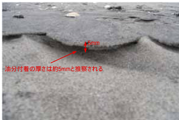
図—9 平薄磯海岸の砂浜の油分付着状況

また、調査時には、強風が吹いた際に砂丘で確認されるような砂嵐のような現象が発生していた。通常の海岸では確認されない現象であり、津波の襲来によって砂浜部分が海底化して細粒分が沈降し、堆積したためであると推察される。