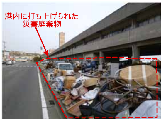
図-16 2011年5月2日現在の小名浜港周辺の状況

また、港内には多数の廃棄物が打ち上げられており、周辺の信号も未だ回復していない状況であった。以上のことより、2011年5月2日現在、震災から2ヶ月近く時間が経過しているにもかかわらず、復旧には未だ遠いという印象であった。小名浜港周辺に打ち上げられた廃棄物の状況を図-16 に示す。