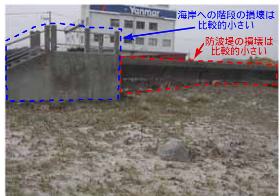
図-2 防波堤の損壊状況