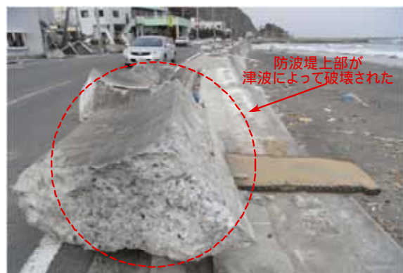
図—10 豊間の防波堤の被災状況