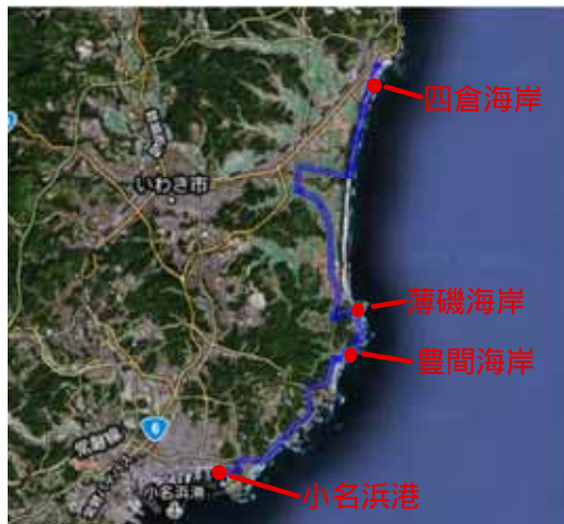
図-1 本調査団の調査経路

本調査団の調査経路を図-1に示す。本調査では、四倉海岸～平薄磯海岸～豊間海岸～小名浜港の順で被災状況を調査した。