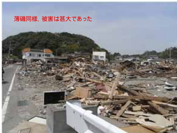
図-12 豊間の防波堤の後背地の被災状況

また、豊間においても防波堤が大きく破壊されたため、防波堤が破壊された平薄磯の後背地の被災状況と同様、後背地の被災状況は甚大なものとなっていた。豊間の防波堤の後背地の被災状況を図-12に示す。