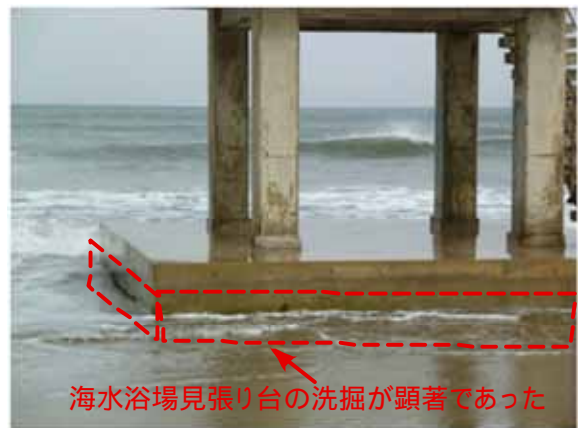
図—8 防波堤の後背地部分と見張り台基礎の洗掘状況