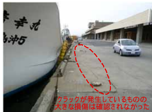
図-14 2011年5月2日現在の小名浜港の岸壁の状況