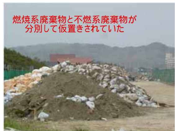
図-17 四倉の震災廃棄物の仮置き場の状況