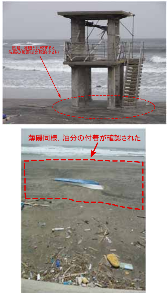
図-13 見張り台の洗掘状況と砂浜の油分付着状況

されたためか、引き波の際に大きな洗掘が生じなかったが、砂浜の油分の固着が広い範囲で確認された。豊間海水浴場の見張り台の洗掘状況および砂浜の油分付着状況を図-13に示す。