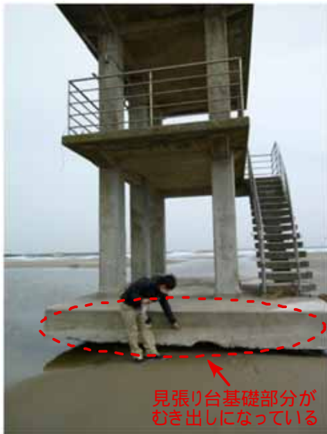
図—4 防波堤基礎下と見張り台基礎の洗掘状況

いずれも基礎部分が大きく洗掘されており、海水浴場見張り台の基礎の洗掘については、基礎がむき出しになるほどのものであった。そのため、四倉海岸全体の地形が大きく変形したと推察される。しかし、消波ブロックを連結して築造されている突堤付近の砂浜では、既設の歩道と思われる個所において、大きな被害は認められなかった。突堤が築造された付近の砂浜と遊歩道の状況を図—5 に示す。以上より、今回のような大規模な津波が沿岸域を襲った場合、防波堤の損壊が比較的小さい地域では、後背地の建物や突堤付近の残存割合が高くなり、防波堤の海岸側の洗掘被害が大きくなると考えられる。