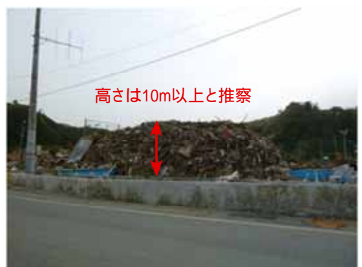
図-18 平薄磯～豊間の区間の震災廃棄物の仮置き場