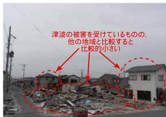
図-3 防波堤の背後地の被災状況