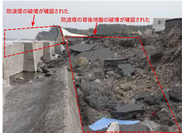
図—6 防波堤および背後地盤の破壊状況

以上の破壊状況の確認結果から、大きな地震動により防波堤が動き、それに伴い後背地が地盤沈下を起こすなど、脆弱な状況に陥り、そこに津波が襲来したことにより、弱っていた防波堤および後背地が大きく破壊された