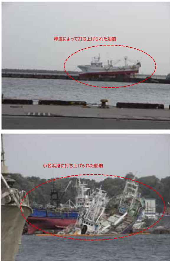
図-15 小名浜港の打ち上げられた船舶の状況

小名浜港では、小規模な亀裂などは多数確認されたものの、岸壁の破損は比較的小さいようであった。しかし、大型の船舶が多数、陸地に打ち上げられており、その対応には多くの時間を要すると推察される。小名浜港の打ち上げられた船舶の状況を図-15 に示す。