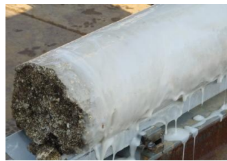
口絵写真-8 ポリマー溶液が試料表面に巻きついた状態