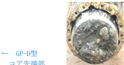
← GP-D型 コア先端部