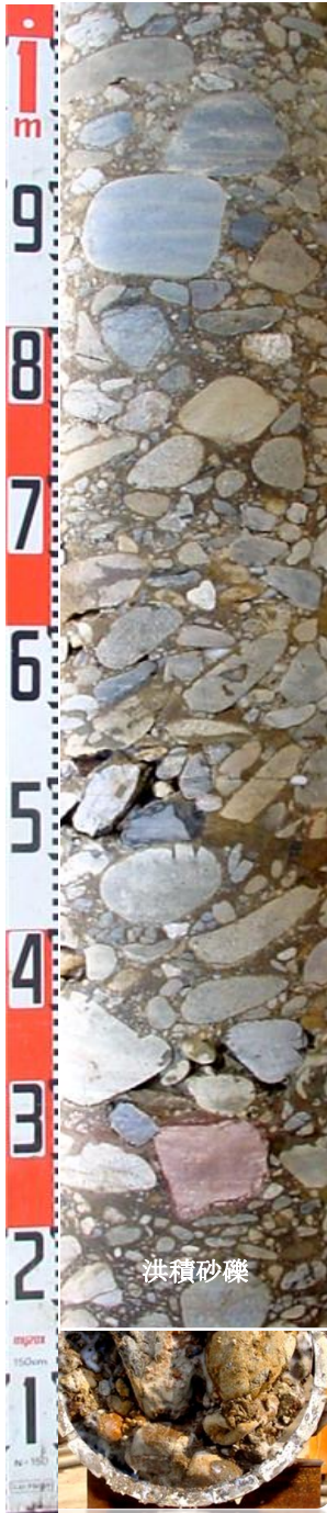
口絵写真-4 GP-D型 砂礫試料