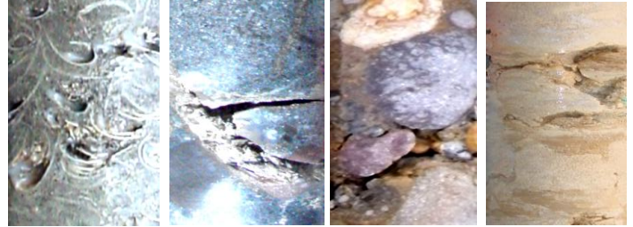
口絵写真-7 GP-D型 採取試料例