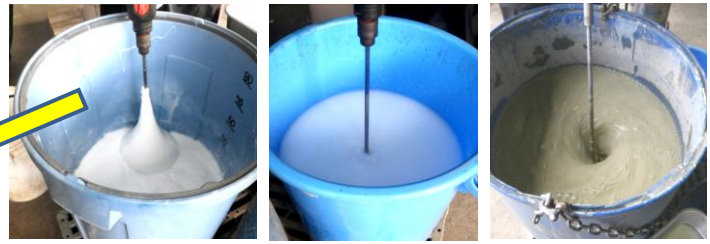
3%ポリマー液 0.3%ポリマー液 ベントナイト