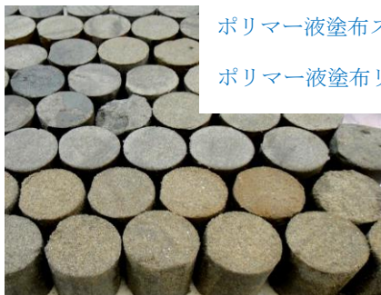
口絵写真-11 GP-Tr GP-S型 砂試料