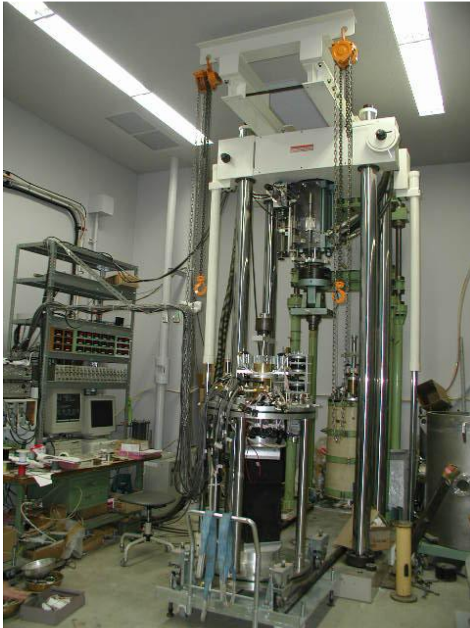
口絵写真-4 大型三主応力試験装置の全体像