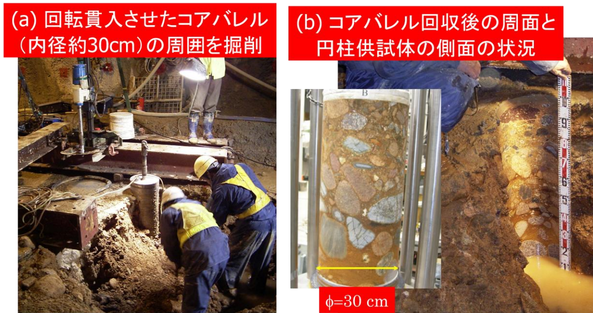
口絵写真-3 大型三軸圧縮試験用の試料採取状況