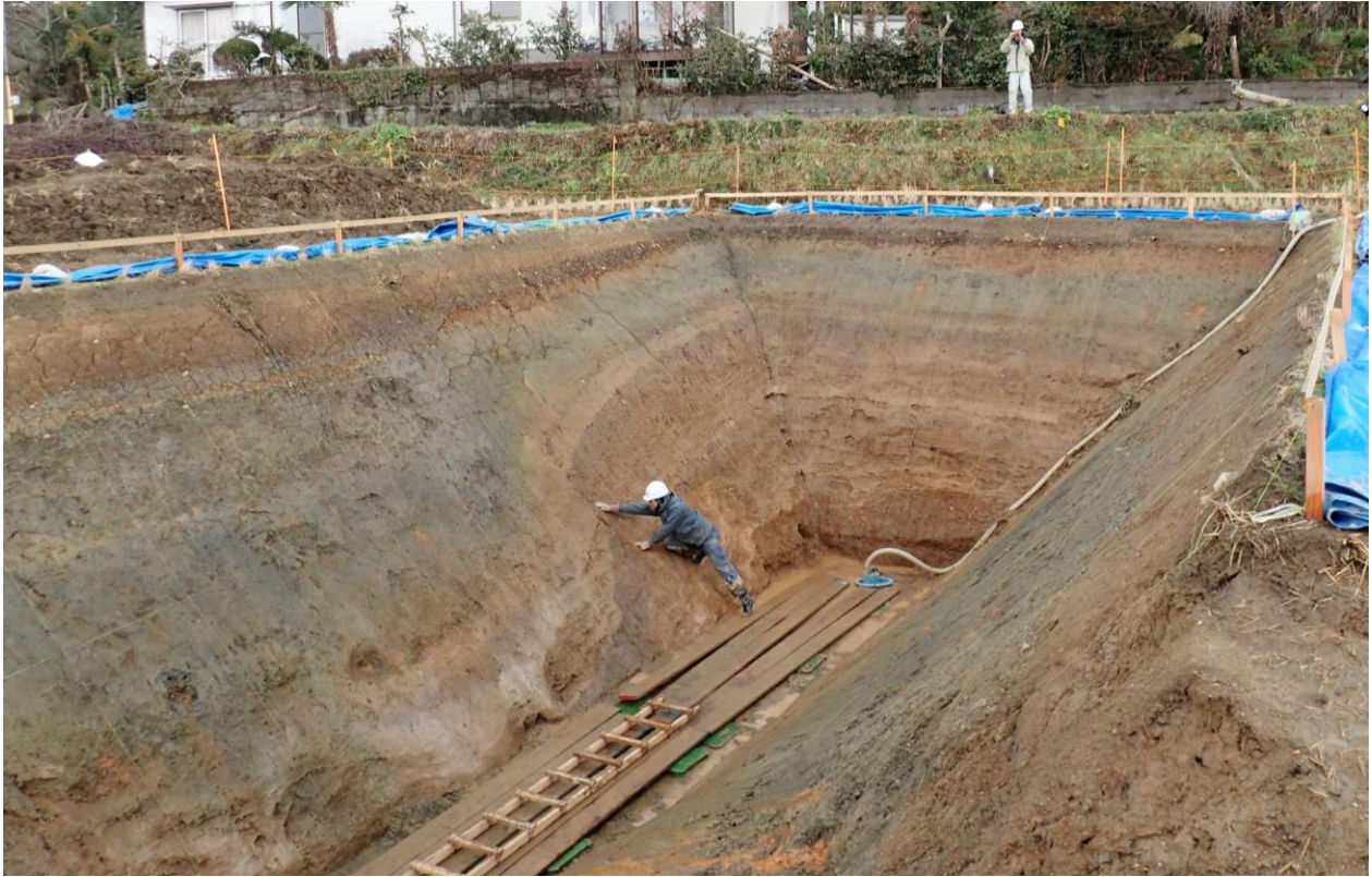
口絵写真-2 山出（やまいで）トレンチ壁面。上益城郡甲佐町白旗山出にて2017年1月に掘削し、3月までの間、調査・観察を実施した。トレンチ壁面の地層は、写真奥側から手前側に向かって撓み混むように変形するとともに、明瞭な断層（調査者の手のあたり）によって切られている。