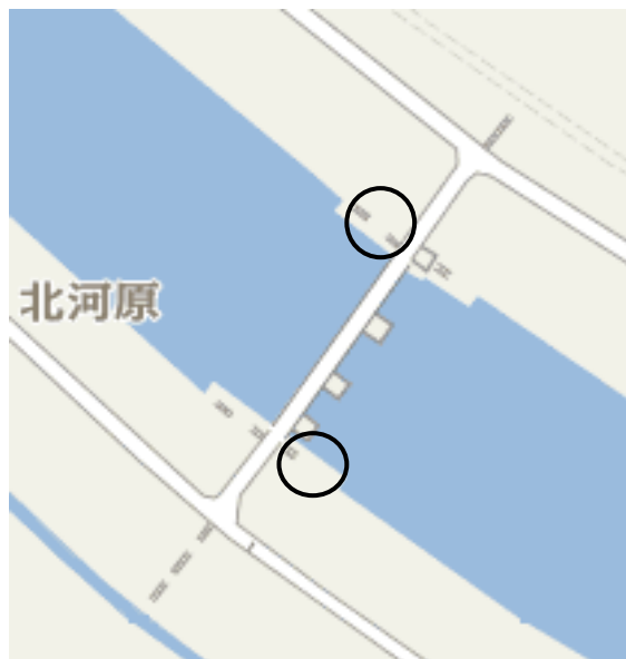
(被害のあった2箇所が水門を挟んで対角位置)