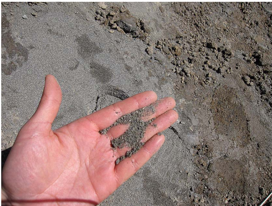
最下部には粒径の比較的揃った細砂層（厚さ 1m 以上）