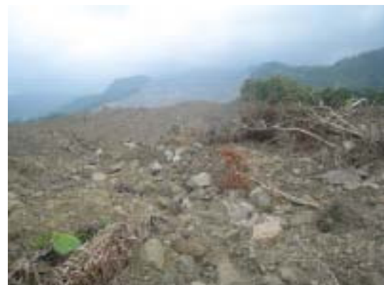
図-13 河岸段丘の上ののぼって上流の滑落崖を望む。累々と崩壊土が凹凸を繰り返しながら続いている。