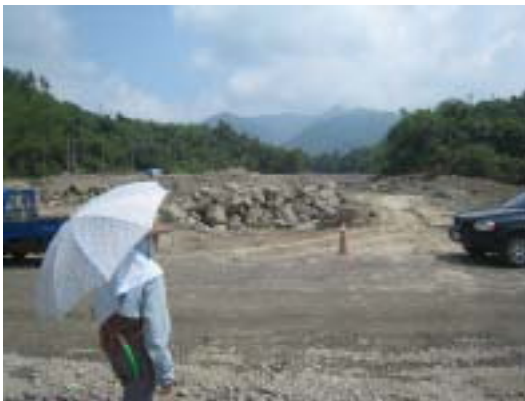
図-6 支流からの土石流の流入