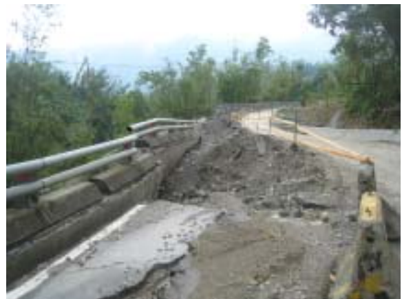
図-18 帰り道に見えた道路擁壁の被害。雨量が非常に多いと、崩壊モードが地震に近づく印象を受けた。