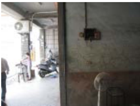
図-2 商店の壁に残った浸水水位（2回）と泥堆積レベル（低いライン）の跡