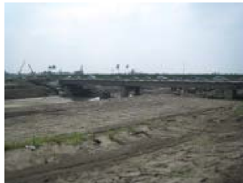
図-3 橋梁の桁に近い高さまで堆積した細粒の多い堆積土。桁には流木が残り，水が橋により堰上げられ洪水に繋がったようだ。