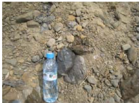
図-16 風化の進んだ泥岩と砂岩の比較。下の泥岩は水をかけると短時間で吸水する。