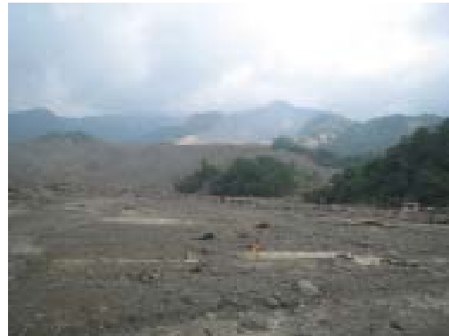
図-8 小林村の跡．斜面崩壊は遠くの尖った峰（標高差 900m）から出発している．