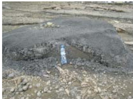
図-15 風化の進んだ泥岩塊。玉ねぎ状に風化が進んでいる。