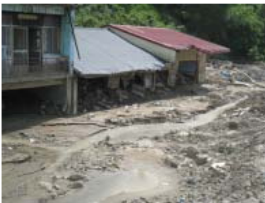
図-7 土石流によって埋まった家屋．