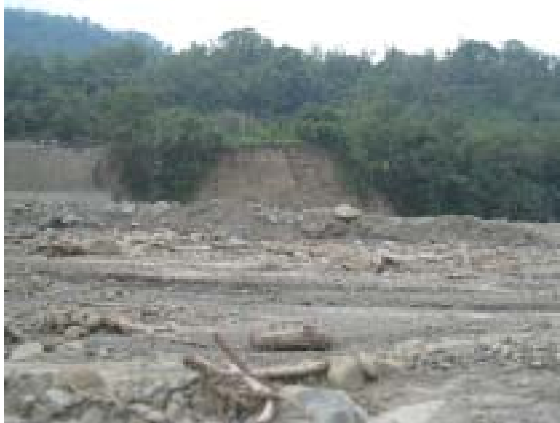
図-12 村はずれの河岸段丘の露頭において、典型的な崩積土が見られた。