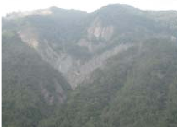
図-17 周辺の山の斜面崩壊も稜線に近いところから出発している。