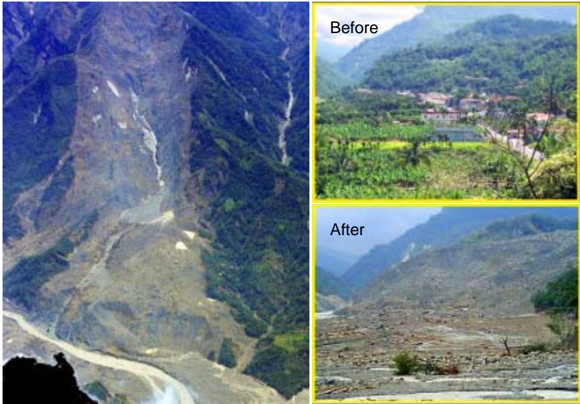
An photo taken from helicopter.