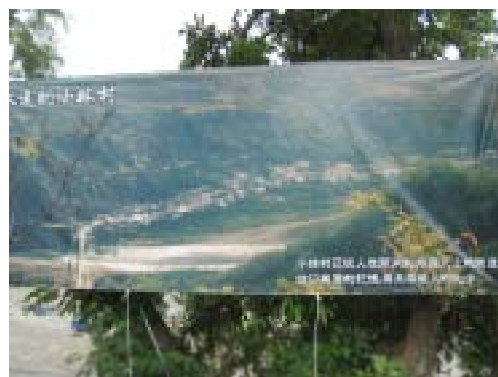
図-10 現地に貼ってある災害以前の村の写真