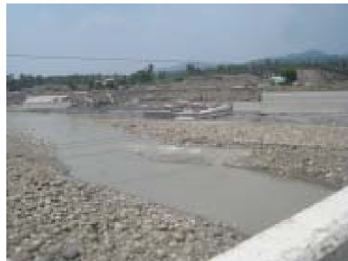
図-4 河川湾曲部で削られた河川堤防