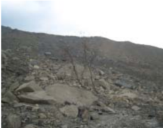
図-11 河岸段丘を崩落した崩壊土塊