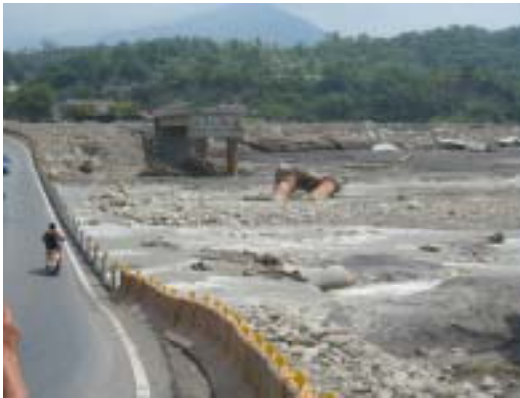
図-5 橋梁の洪水（土石流？）倒壊．泥岩基礎に打設した鋼管杭が折れ曲がっている．