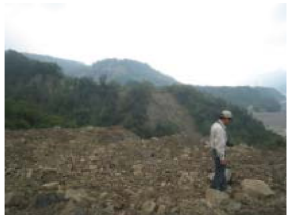
図-14 崩壊土で覆われた段丘から隣の影響を免れた段丘を望む。