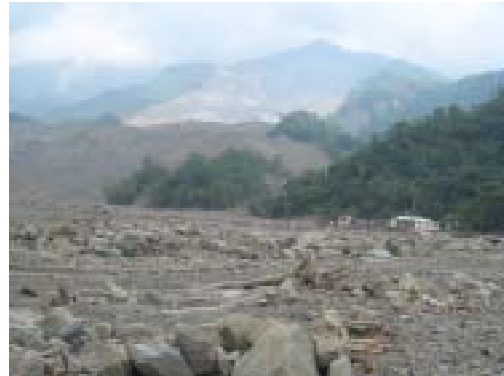
図-9 右側の 2 軒のみが残り，その左側にあった集落は 100m ほどの河岸段丘からの崩壊土によりすべて消失．段丘下部の残った緑は動いた形跡は見られず．