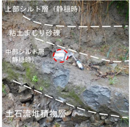
(右) D 地点, (左) E 地点