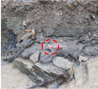
(右) B 地点, (左) C 地点