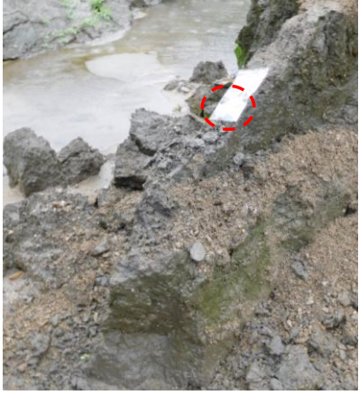
(右) F 地点, (左) G 地点