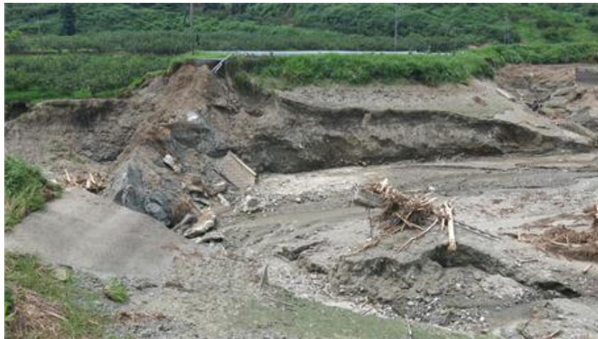
口絵写真-2 堤体決壊後の山の神ため池(平成29年7月22日撮影)