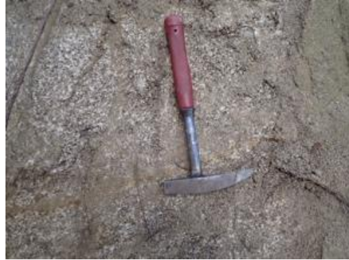
頭部滑落崖のまさ土(近景)