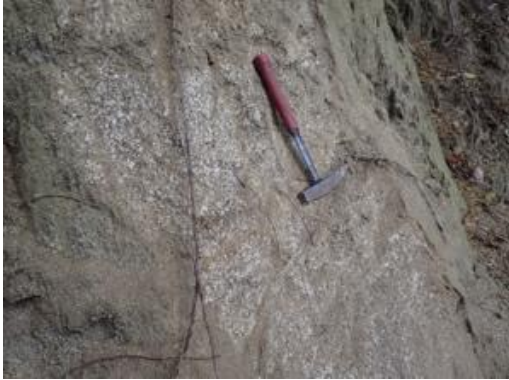
頭部滑落崖のまさ土