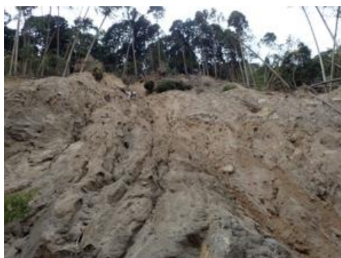
サイト2 全景(崩壊地上方を望む)