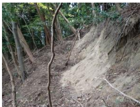
頭部滑落崖の状況