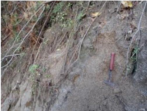
側部滑落崖の鬼まさ