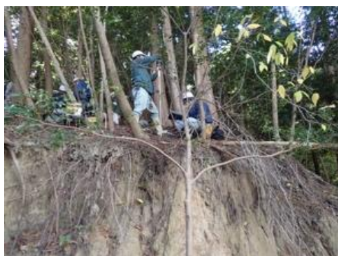
頭部滑落崖背後での試験状況