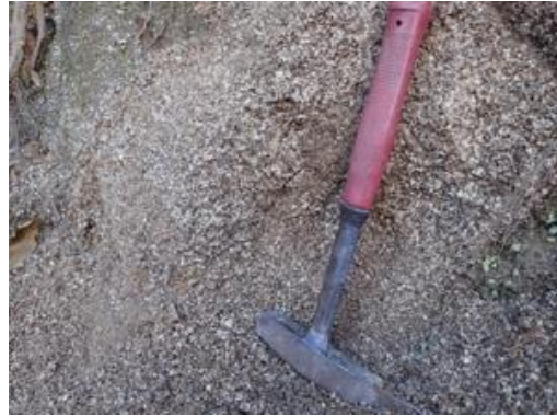
側部滑落崖の鬼まさ(近景)