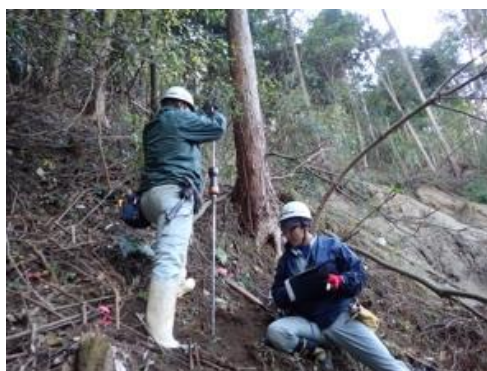
側部滑落崖背後での試験状況