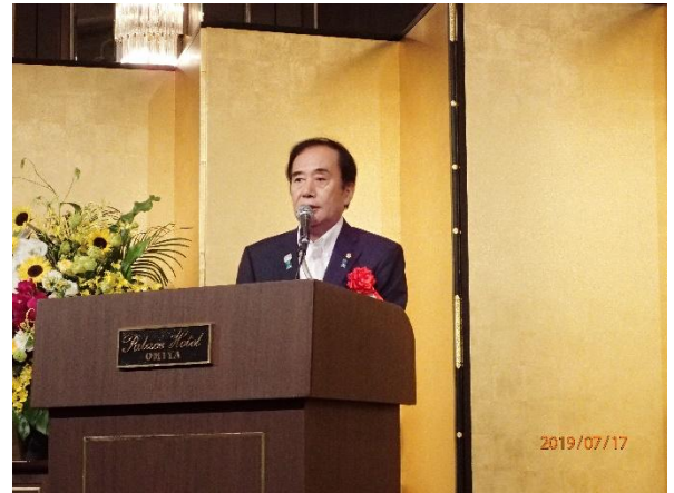
写真-18 交流会（上田清司埼玉県知事による祝辞）