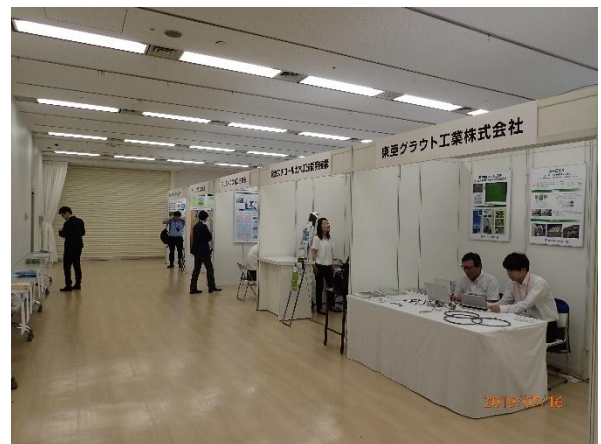
写真-8 技術展示コーナー (B会場)