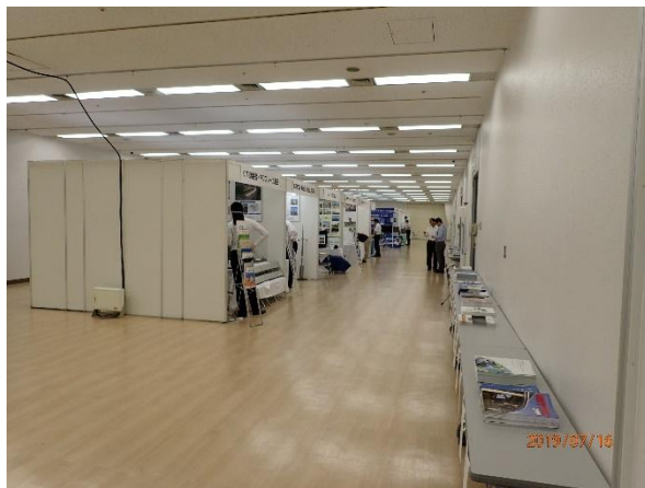
写真-7 技術展示コーナー (B会場)