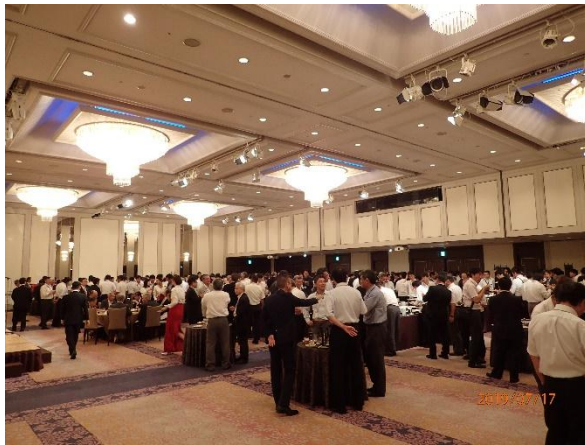
写真-13 交流会の様子