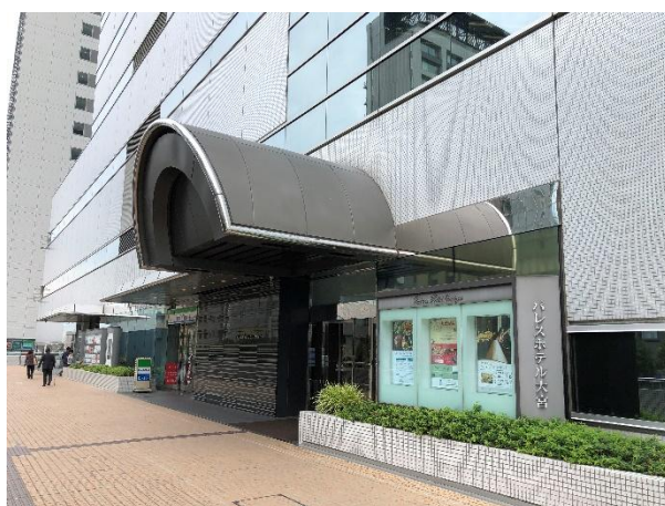
写真-3 交流会会場の大宮パレスホテルの入口