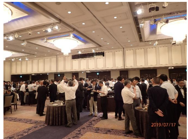
写真-14 交流会の様子