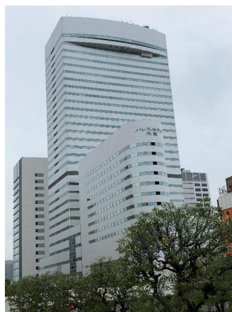
写真-2 研究発表会会場の大宮ソニックシティビル（奥）と交流会会場の大宮パレスホテル（手前）