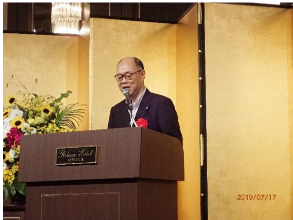
写真-19 交流会（阪口進一さいたま市副市長による祝辞）