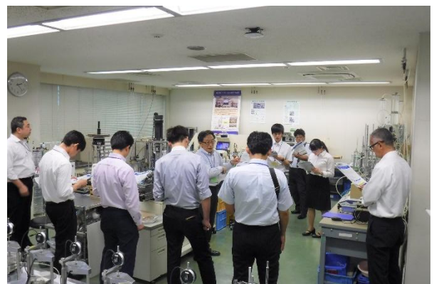
写真-10 見学会の様子 (OYO コアラボ試験センター)