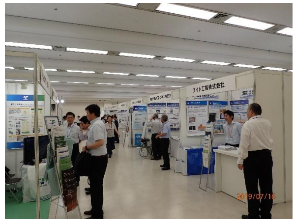
写真-6 技術展示コーナー (A会場)