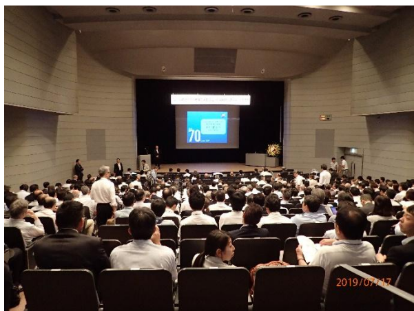
写真-23 特別講演会のメイン会場となった小ホール