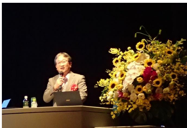
写真-27 森昌文前国土交通事務次官