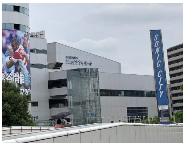
写真-1 研究発表会及び特別講演会会場となった大宮ソニックシティホール