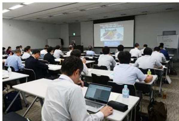
写真-28 市民向け講演会の様子