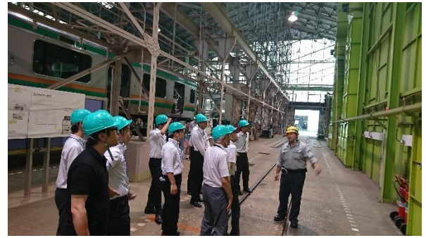
写真-12 見学会の様子 (JR 東日本大宮総合車両センター)