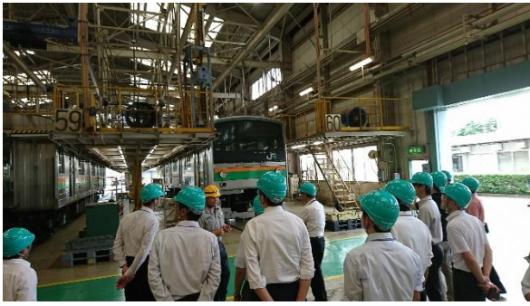
写真-11 見学会の様子 (JR 東日本大宮総合車両センター)