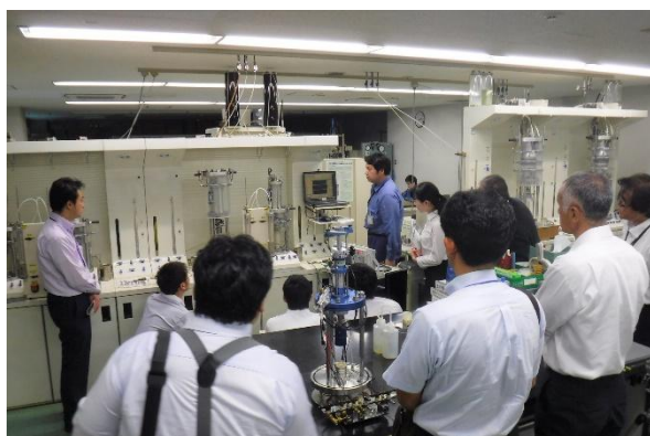
写真-9 見学会の様子 (OYO コアラボ試験センター)