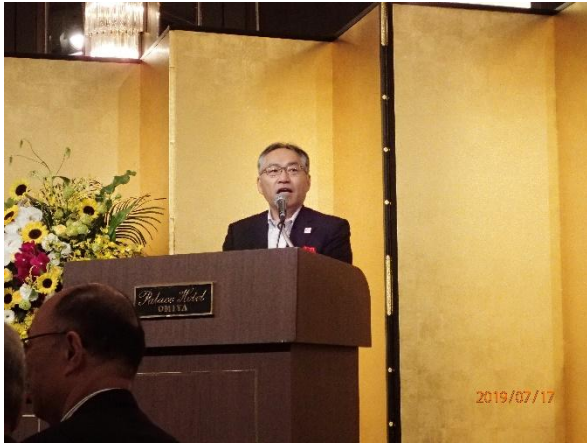
写真-17 交流会（石原康弘関東地方整備局長による祝辞）