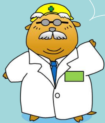
地盤工学会公認キャラクター ドクターモグ

本イベント開催にあたり、下記の学会および委員会より後援をいただく予定です。 この場をお借りして御礼申し上げます。